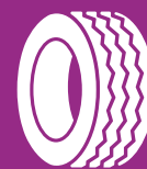
DÄCK UTAN FÄLG Tyres without rims

Bildäck utan fälg, cykeldäck utan fälg, däck till skottkärra utan fälg