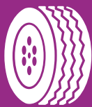
DÄCK MED FÄLG Tyres with rims